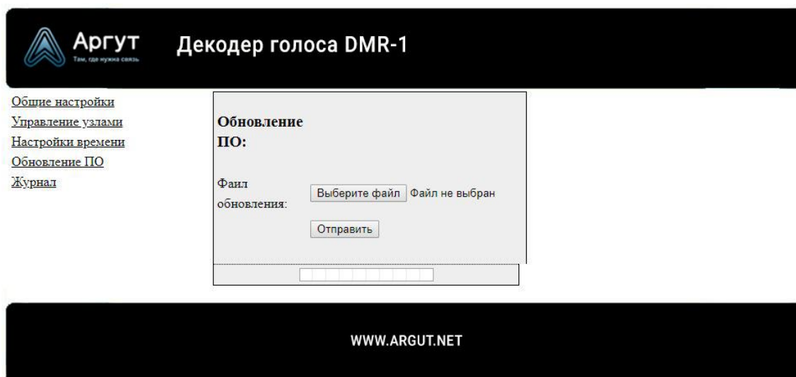
Рис. 8. Окно обновления ПО

Для загрузки окна обновления ПО выберите «Обновление ПО» в левой части экрана. Окно обновления ПО изображено на рисунке 8.