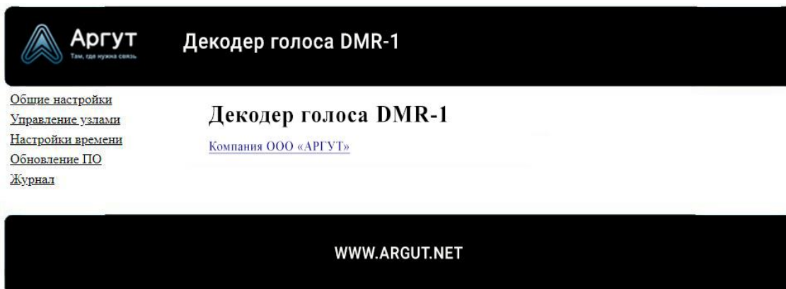
Рис. 4. Окно приветствия

В окне веб-браузера загрузится окно приветствия (рисунок 4).